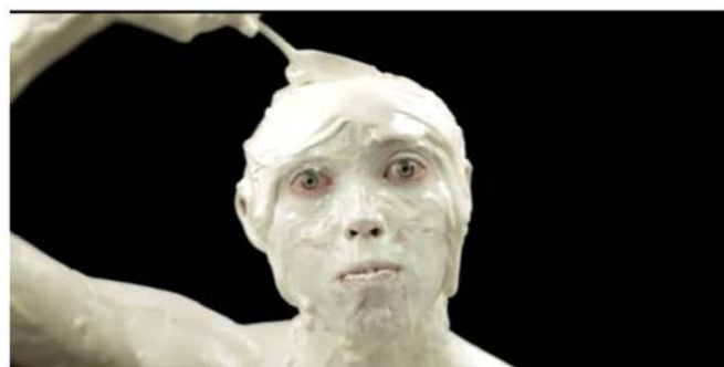
DER UNSICHTBARE TEICH