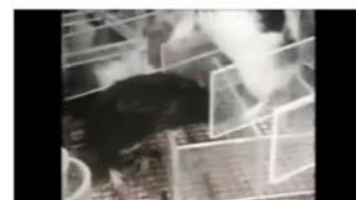
Stills aus Robert Sieg: Der unsichtbare Teich, Dokumentarfilm/Essay, 75 min., 2017 (© Robert Sieg)