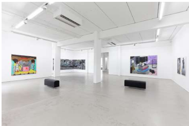
4. Ausstellungsansicht COLORS OF DESCENTS mit Werken von Tobias Hild, Robert Seidel & Julius Hofmann, 25. Mai – 17. September 2017, G2 Kunsthalle Leipzig. © G2 Kunsthalle Leipzig, Foto: Dotgain.info für die abgebildeten Kunstwerke: © Tobias Hild, courtesy the artist © Robert Seidel, courtesy the artist & ASPN Galerie, Leipzig © Julius Hofmann, courtesy the artist & Galerie Kleindienst, Leipzig

+49 (0)341 35 57 37 93 info@g2-leipzig.de www.g2-leipzig.de