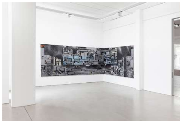
6. Ausstellungsansicht mit »Player« (2015–2017, Triptychon) von Robert Seidel, COLORS OF DESCENTS – Tobias Hild / Julius Hofmann / Robert Seidel, 25. Mai – 17. September 2017, G2 Kunsthalle Leipzig. © G2 Kunsthalle Leipzig, Foto: Dotgain.info für das abgebildete Kunstwerk: © Robert Seidel, courtesy the artist & ASPN Galerie, Leipzig