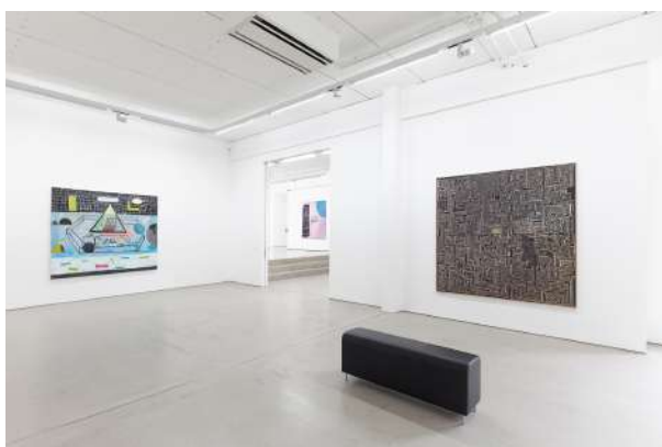
7. Ausstellungsansicht mit Werken von Tobias Hild & Robert Seidel (rechts), COLORS OF DESCENTS – Tobias Hild / Julius Hofmann / Robert Seidel, 25. Mai – 17. September 2017, G2 Kunsthalle Leipzig. für die abgebildeten Kunstwerke: © Tobias Hild, courtesy the artist © Robert Seidel, courtesy the artist & ASPN Galerie, Leipzig