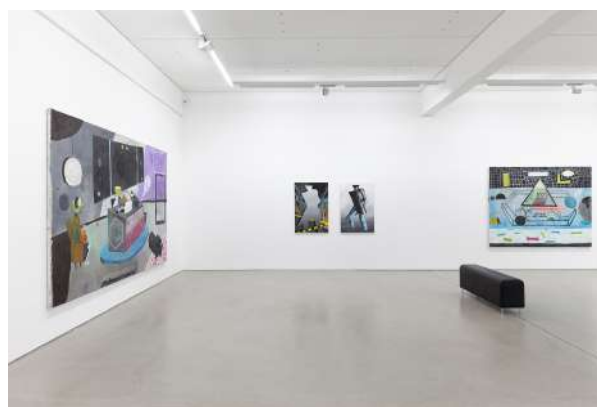
8. Ausstellungsansicht mit Werken von Tobias Hild & Julius Hofmann (mitte, Diptychon), COLORS OF DESCENTS – Tobias Hild / Julius Hofmann / Robert Seidel, 25. Mai – 17. September 2017, G2 Kunsthalle Leipzig. für die abgebildeten Kunstwerke: © Tobias Hild, courtesy the artist © Julius Hofmann, courtesy the artist & Galerie Kleindienst, Leipzig