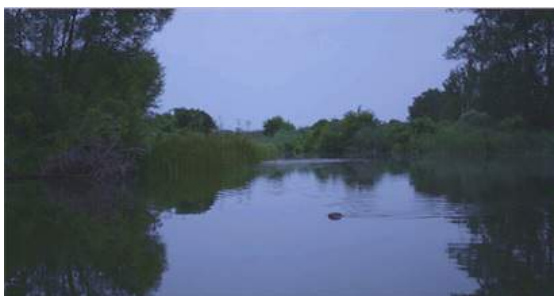
6. Szene aus »The Setting«, NARRATION (2016) © Thomas Taube