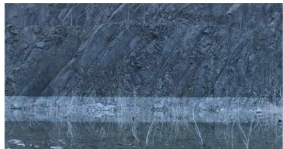
13. Szene aus »The Setting« NARRATION (2016)