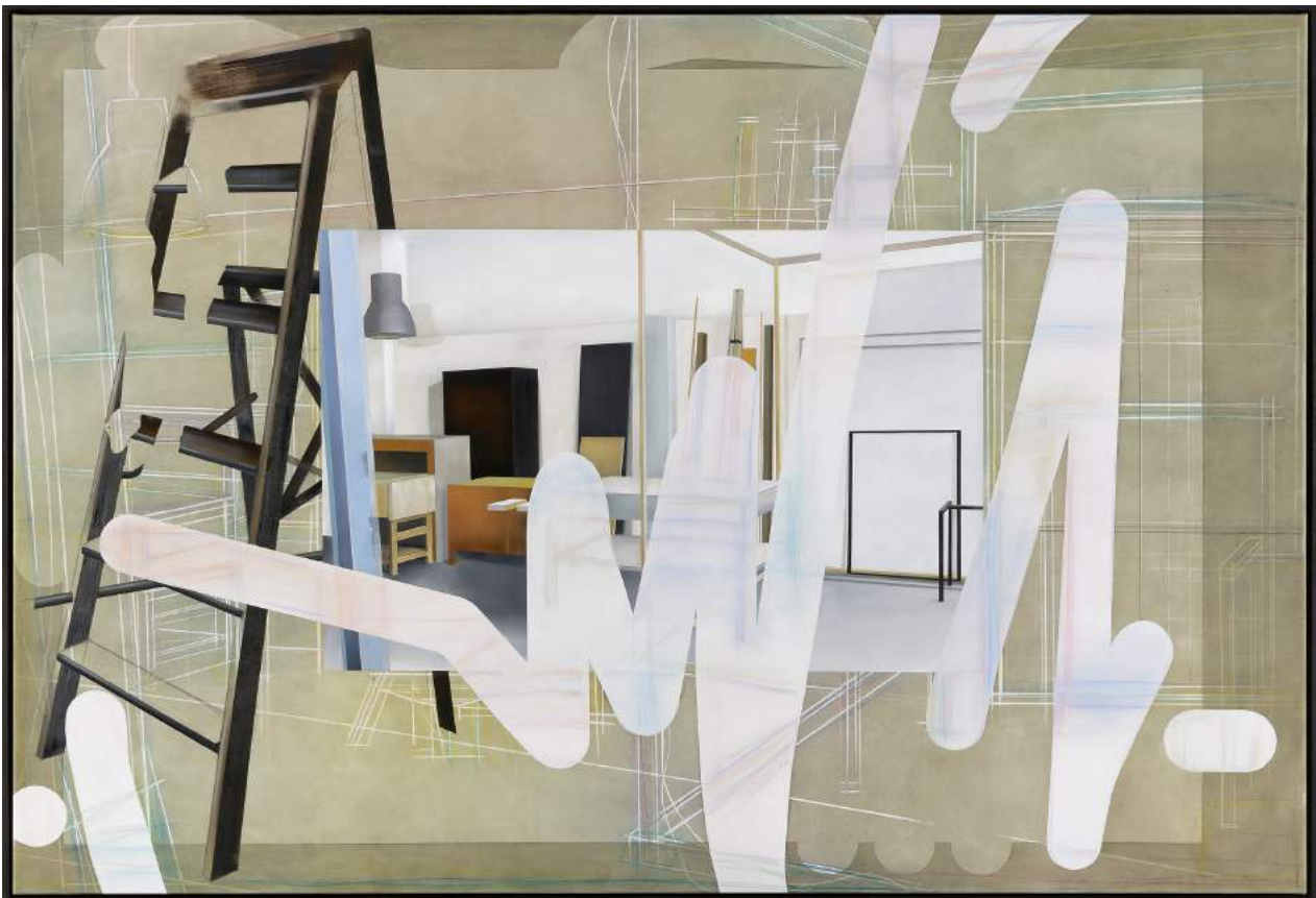
9. Oskar Rink, ATELIER, 2018, Öl auf Leinwand, 170 x 250 cm © Oskar Rink