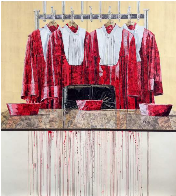
8. Marcel Odenbach, geb. 1953 in Köln, lebt und arbeitet in Berlin, Köln und Cape Coast (Ghana) Abgelegt und Aufgehungen , 2013, Collage auf Papier, 225 x 208 cm © Marcel Odenbach / VG Bild-Kunst Bonn 2018, courtesy Anton Kern Gallery, New York

+49 (0)341 35 57 37 93 info@g2-leipzig.de www.g2-leipzig.de