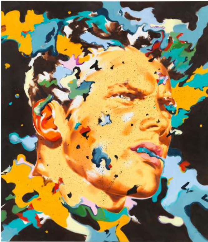
2. Norbert Bisky, geb. 1970 in Leipzig, lebt und arbeitet in Berlin Malandro , 2017, Öl auf Leinwand, 230 x 200 cm © Norbert Bisky / VG Bild-Kunst Bonn 2018 courtesy the artist & KÖNIG Galerie, Berlin/London photo: Bernd Borchardt