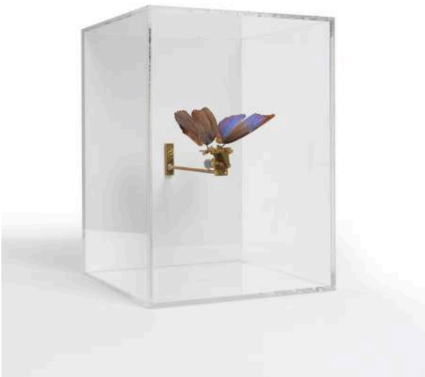
4. Rebecca Horn, geb. 1944 in Michelstadt, lebt und arbeitet in Berlin, Paris und Bad König Schmetterling, 2006, Schmetterlingsflügel, Metall, elektrischer Motor, 30 x 22 x 22 cm

G2 Kunsthalle Gottschedstraße 2 04109 Leipzig Germany