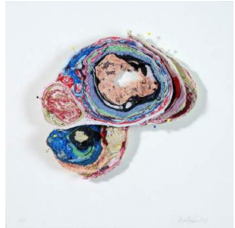
3. Birgit Dieker, geb. 1969 in Gescher, lebt und arbeitet in Berlin & Stuttgart Hirnschnitt , 2012, Kleidungsstoff und Stecknadeln auf Karton, 25 x 29 x 3 cm Auflage 1/25 (Unikate) © Birgit Dieker / VG Bild-Kunst Bonn 2018

+49 (0)341 35 57 37 93 info@g2-leipzig.de www.g2-leipzig.de