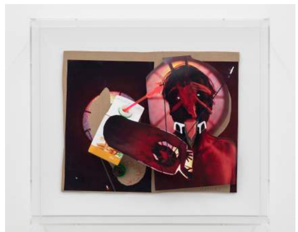
5. John Bock, geb. 1965 in Gribbohm, lebt und arbeitet in Berlin o.T. , 2017, verschiedene Materialien, 44 x 51 x 15,5 cm © John Bock, courtesy the artist & Sprüth Magers, photo: Timo Ohler